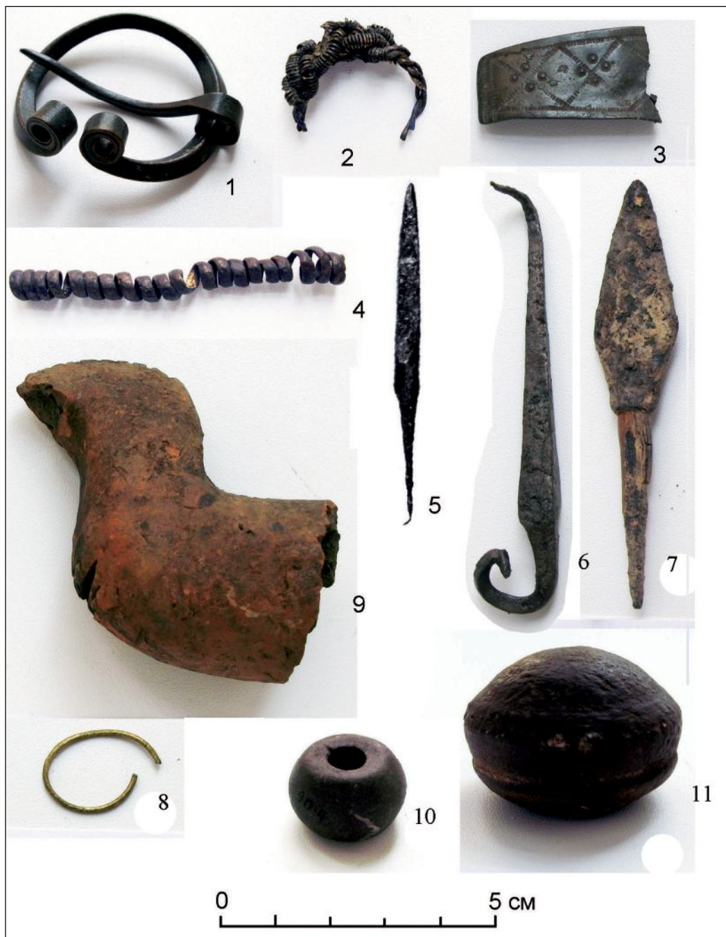
Рис. 2. Находки XI–XIV вв. из культурного слоя селища: