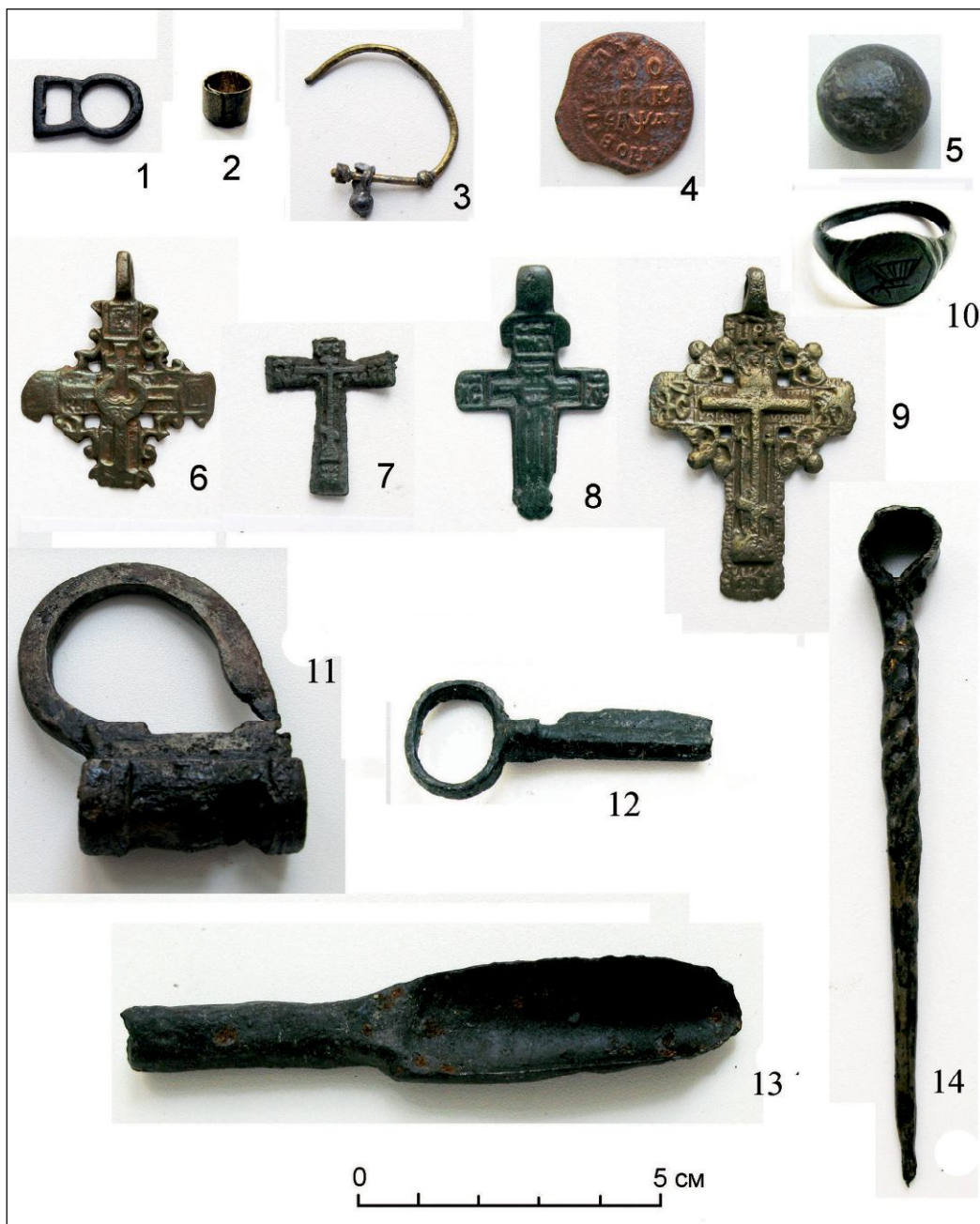
Рис. 3. Находки XV–XVIII вв. из культурного слоя селища: 1 — пряжка, 2 — обоймица, 3 — серьга, 4 — деньга 1713 г., 5 — пуля; 6–9 — нательные кресты, 10 — перстень-печатка с изображением птицы; 11 — замок; 12 — ключ; 13 — резец; 14 — булавка; 1–10 — цветной металл, 11–14 — железо