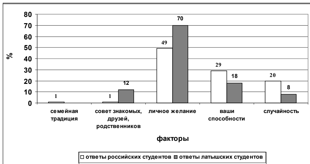
Рис. 1. Факторы, определяющие выбор профессии

В процессе исследования студентам задавали вопросы: "Чем определялся Ваш выбор профессии?" (рис. 1).