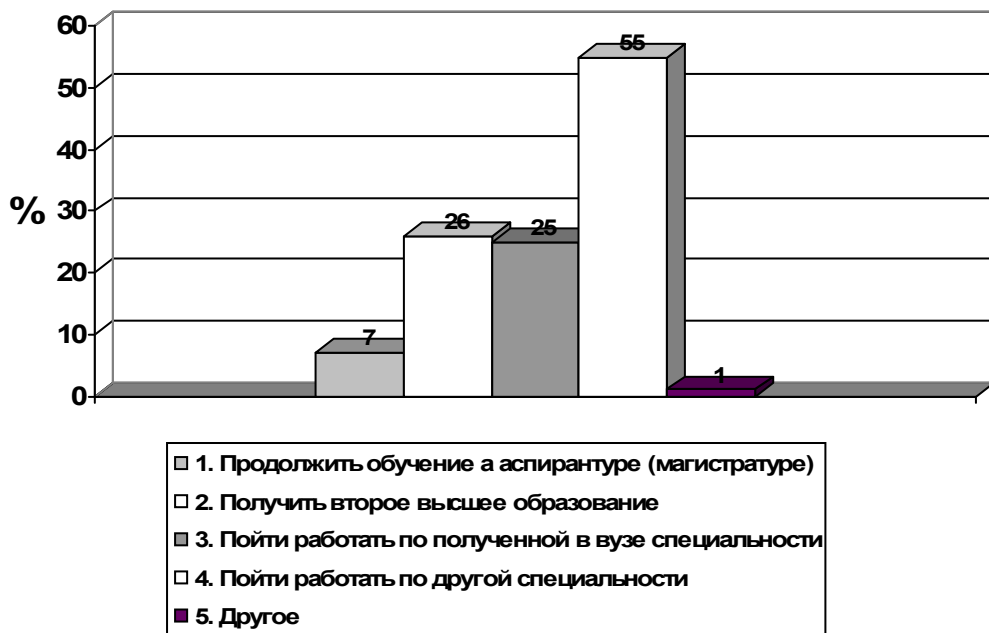
Рис. 2. Планы российских студентов на ближайшие три года

Каковы Ваши планы на ближайшие три года? (ответы латышских студентов)