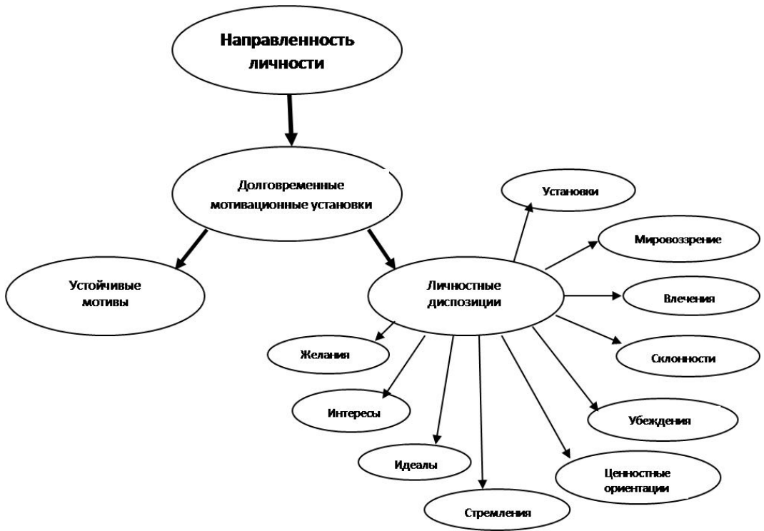
Рис.1. Структура направленности личности

Рассмотрим, каким образом указанные компоненты направленности задействованы в рефлексивном анализе трудных жизненных ситуаций, способствуя активизации и поддержанию устойчивости личности, столкнувшейся с препятствиями и опасностями.